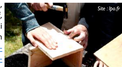
Site : lpo.fr