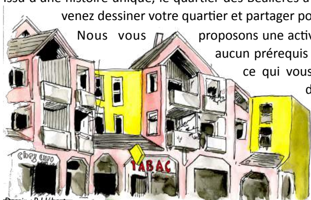
Dessin : P. Hébert

Vous serez accompagné pour le choix du sujet, du point de vue mais aussi pour le cadrage, la technique de réalisation, les règles de perspectives... Cela se déroulera sur 4 à 6 séances de 2 heures, en fin de journée ou le week-end, entre début mai et mi-juin 2024. Ces séances seront encadrées par Pierre Hébert, carnettiste et habitant des Béalières.